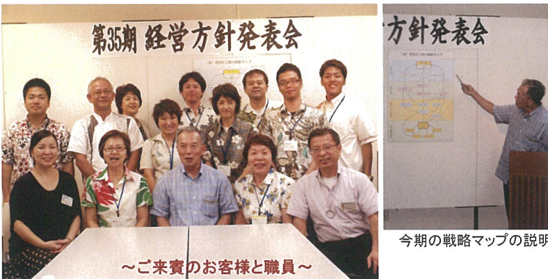
第35期経営方針発表会

私のお奨めの一冊 「小さな人生論」山城東雄著 致知出版 致知出版社 致知出版社 致知出版社