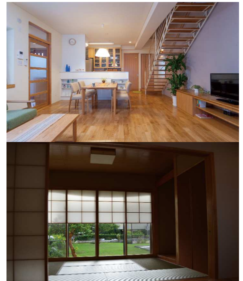
2015年11月20日 タイムス住宅新聞掲載