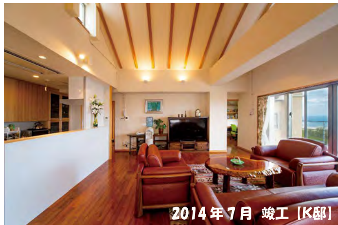
2014年7月 竣工 [K邸]